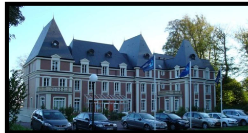
Château de Maniquerville